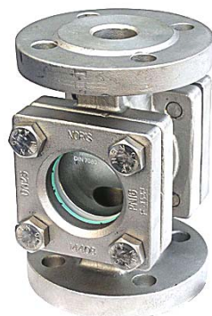
DN 15 - 50 ( Deckel quadratisch )