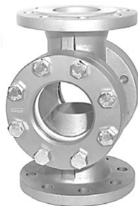
DN 65 - 250 ( Deckel rund )

* D in ( ) entsprechend PN 25 / PN 40 ** 16 bar nur mit Borosilikatglas lieferbar *** bei Grauguß Glasabmessung Ø 80x12 > DN 100 und PN 40 in Anlehnung an DIN 3237