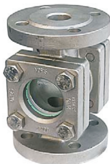
DN 15 - 50 (čtvercové víko)

Průhledítko Bauform 880, GG 25, s borosilikátovým sklem DIN 7080 DN 50, PN 16