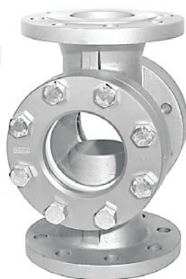
DN 65 - 250 (kruhové víko)